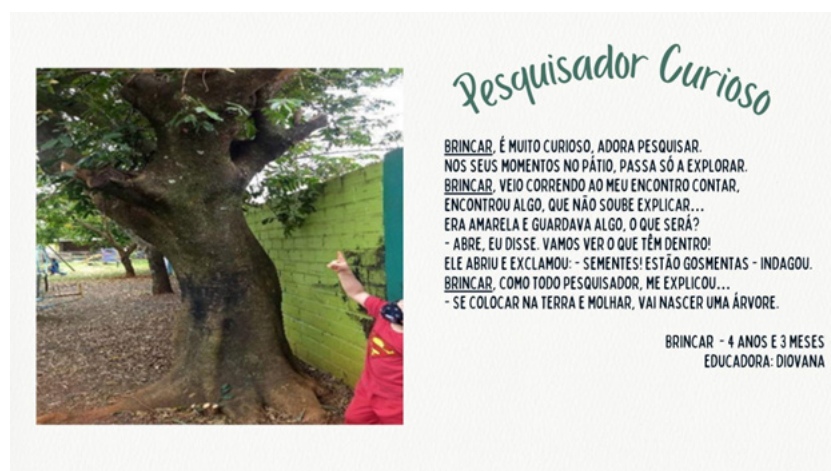
Figura 1: Registro 1 - Documentação pedagógica intitulada “Pesquisador Curioso”

Pesquisador Curioso (Figura 1), documenta as investigações do Brincar 1 , criança pesquisadora desde a primeira infância em meio a todo o caos do retorno ao novo normal, demonstrou curiosidades na imensidão do pátio escolar e através de todas as investigações e muitos questionamentos pelo processo de ensino e aprendizagem possibilitado, apropriou-se de todo conhecimento ali expresso. O brincar é uma parte fundamental do processo de aprendizagem na primeira infância e é a partir da documentação pedagógica que podemos capturar essas experiências de brincadeira para entender como a criança está explorando seu ambiente e construindo conhecimento através do jogo. Para Melo et al. (2024), é no brincar que as crianças confrontam suas próprias zonas de desenvolvimento, constroem modos de pensar, sentir etc. desta forma as crianças internalizam a cultura, desenvolvem-se para constituir sua subjetividade.