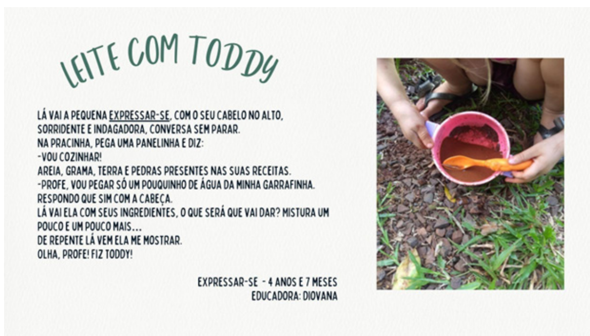
Figura 2: Registro 2 - Documentação pedagógica intitulada “Leite com Toddy”.