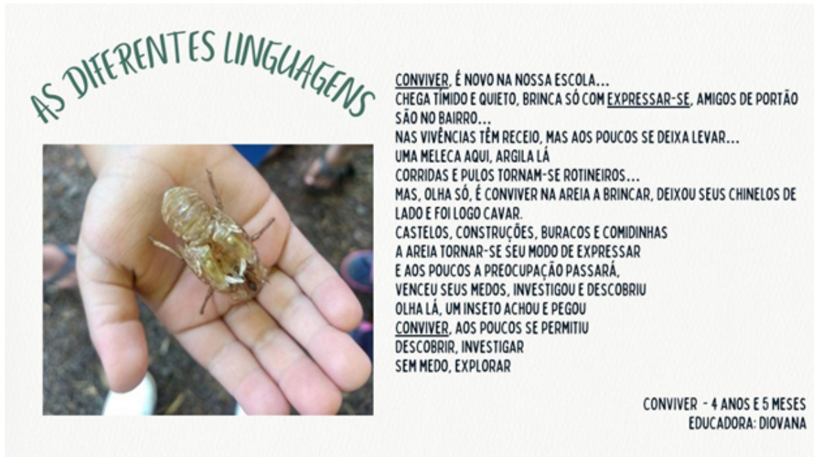
Figura 3: Registro 3 - Documentação pedagógica intitulada “ As diferentes linguagens”