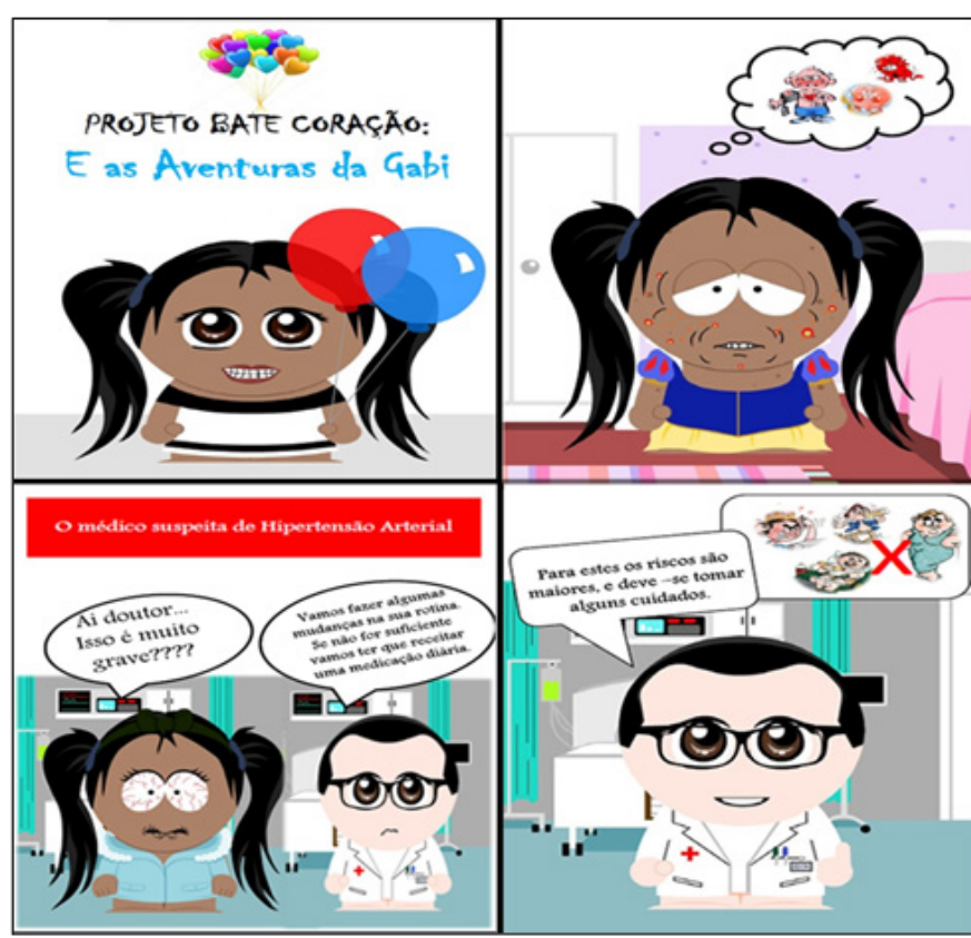
Figura 3 - Fragmentos do cartoon Projeto Bate coração e as aventuras de Gabi

Esse trabalho fundamentou-se na proposta de educação popular de Paulo Freire, com contação de história em varal. Associou-se a situação do personagem central, a Gabi, uma criança em idade escolar (tal como os estudantes) com a descoberta da HAS. Por tratar-se de uma situação cotidiana, os alunos puderam se colocar no lugar da personagem, interagindo com perguntas e contando fatos da sua família ao final da apresentação da história. O texto, bem como a construção das imagens se deu após a revisão da literatura pelos alunos e de estudos em grupo. Montou-se a história e o roteiro foi finalizado após a discussão entre os acadêmicos de Farmácia, um acadêmico do Curso de Biologia, bolsista do projeto PIBID na escola e a professora de Biologia vinculada ao PIBID na escola cenário de realização do projeto, com a orientação dos professores de Farmácia e Biologia da Universidade (Figura 3), configurando o caráter interprofissional desta ação.