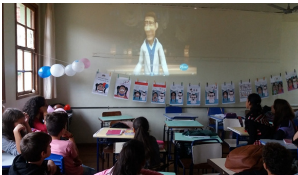
Figura 4 - Varal da história de Gabi e a projeção de vídeo sobre o assunto

O formato varal apresenta como principal vantagem não precisar de equipamentos eletrônicos na montagem, é um método simples, pois necessita-se apenas montar um varal e a fixação das partes da história se dá usando prendedores de roupas. Além disso, há como trabalhar a curiosidade dos alunos à medida que a história vai sendo contada, pois cria-se uma expectativa nos alunos sobre a sequência dos acontecimentos, além de possibilitar a observação da sequência do trabalho em exposição. Ao final, os alunos podem observar toda a história, como se estivessem percorrendo uma trilha (Figura 4).